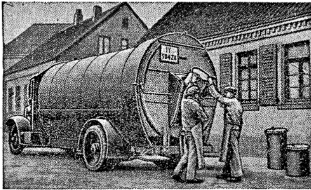
Fortschrittliche Müllabfuhr in Hameln

Die Stadt Duisburg mit dem größten Binnenhafen der Welt, die Anspruch darauf erhebt, Großstadt zu sein, mit ihrem Stadttheater, mit dem neuzeitlich, modern eingerichteten Hotelhaus und seinen Strandanlagen, hat noch die rückschrittlichste Müll-